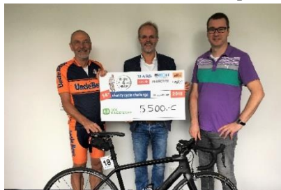
Checkübergabe SOS Kinderdorf 2019

Im Jahr 1949 baut Hermann Gmeiner gemeinsam mit seinen Freunden das erste ‚SOS-Kinderdorf‘ in Imst, Tirol. Seine simple wie geniale Idee findet so großen Zuspruch, dass es im Jahr 1960 in Europa bereits zehn SOS-Kinderdörfer mit rund hundert